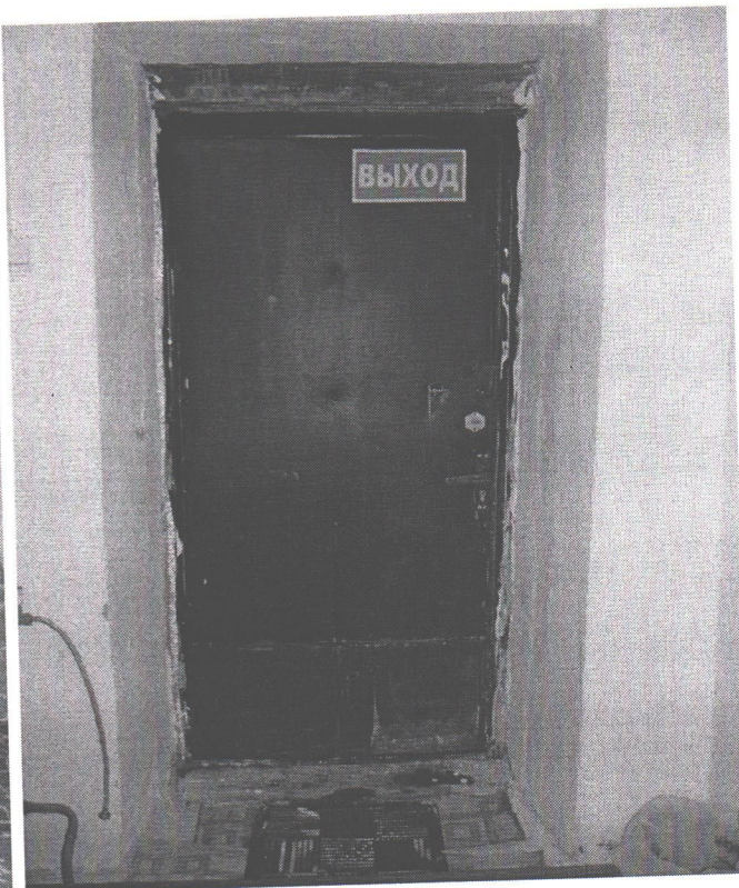
Запасный выход 1